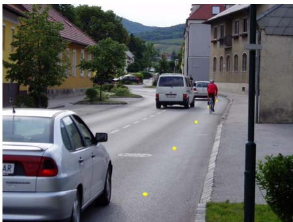
Schematische Darstellung Phase 2

Sollte es nach einer Evaluierung durch das Kuratorium für Verkehrssicherheit zu keiner Verbesserung für die Radfahrer kommen, werden in einer zweiten Projektphase zusätzlich zu den drei Wechselverkehrszeichen sogenannte LaneLights (Markierungsleuchtknöpfe) in Fahrbahn integriert. Diese werden gleichzeitig mit dem Wechselverkehrszeichen aktiviert und stellen durch ihr Leuchten einen temporären Radfahrstreifen dar. Verlassen die Radfahrer den Systembereich, so werden die Wechselverkehrszeichen und der temporäre Radfahrstreifen deaktiviert.